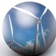
Windkraft Aufbau von Windparks