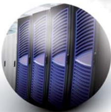
IT Aufbau von IT-Infrastruktur, Soft- und Hardware Roll-Outs